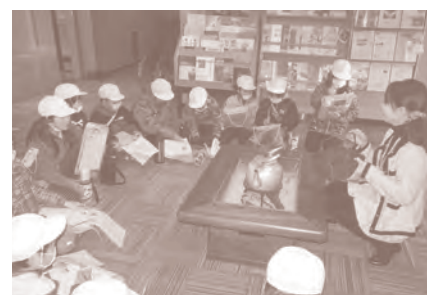
冬の生活道具 火鉢を体感 寒い冬の1日、あたたかい火鉢を囲んで当時の暮らしに思いを馳せる学習プログラムです。

例えば、平安時代の窯、猿投古窯(さなげこよう)について、授業でとりあげてみませんか。やきものの歴史や復元窯による陶芸作品づくり、収蔵品の鑑賞、昔のくらし体験など、地域の博物館施設を利用した体験型の学習プログラムを提供します。まずはお気軽にご相談ください。