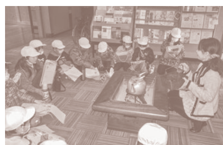
冬の生活道具 火鉢を体感 寒い冬の1日、あたたかい火鉢を囲んで当時の暮らしに思いを馳せる学習プログラムです。

例えば、平安時代の窯、猿投古窯(さなげこよう)について、授業でとりあげてみませんか。やきものの歴史や復元窯による陶芸作品づくり、収蔵品の鑑賞、昔のくらし体験など、地域の博物館施設を利用した体験型の学習プログラムを提供します。まずはお気軽にご相談ください。